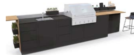
Eld Vatten 7

der Profi-Küchen: Die Korpusbauweise auf Rollen oder freistehendem Sockel – mit Blende oder auf freistehenden Füßen – trägt dazu ebenso bei, wie die hochwertigen Pulveroberflächen in RAL-Farben sowie die außen liegenden Beschläge der nach innen schlagenden Türen.